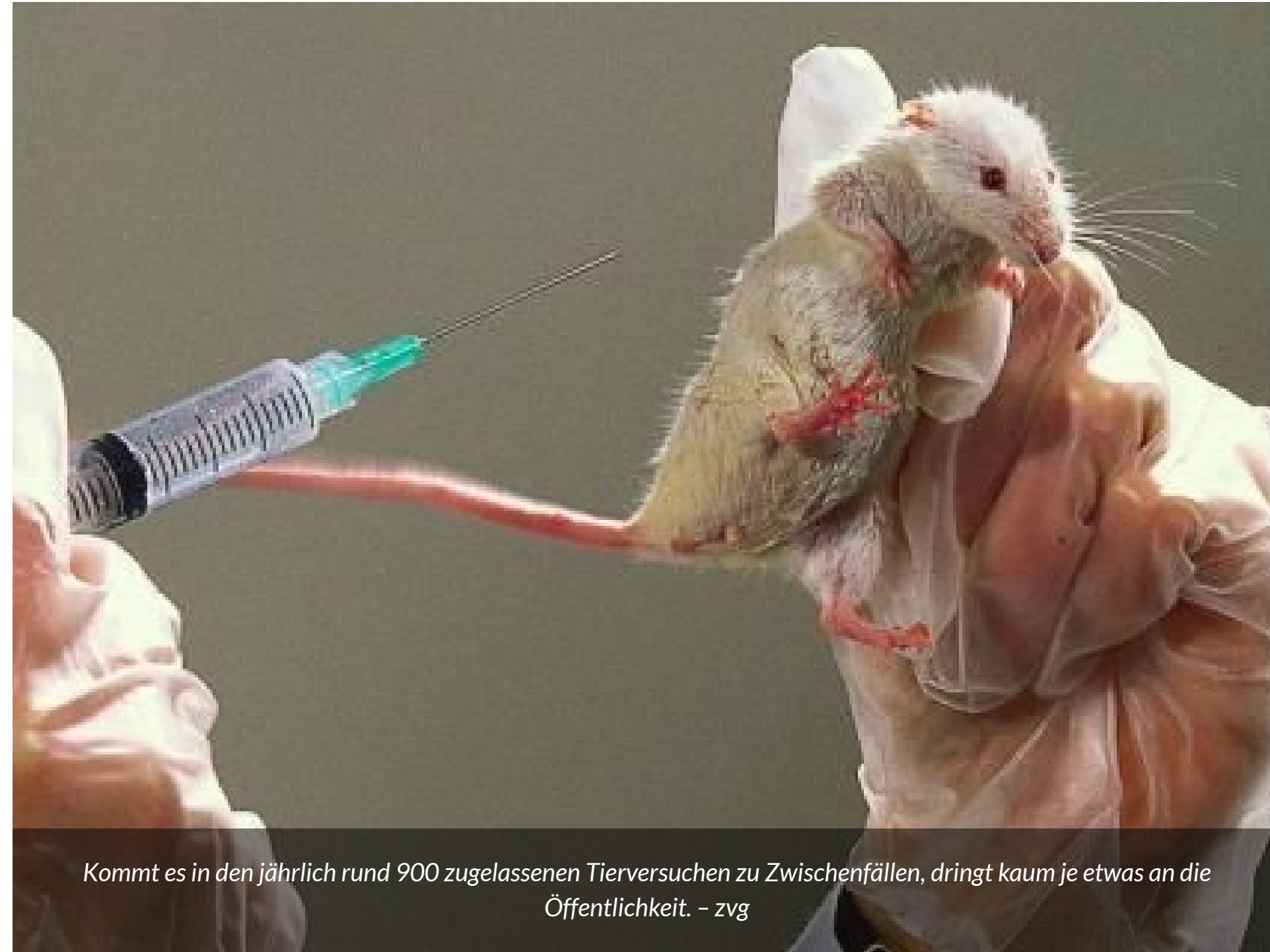
Kommt es in den jährlich rund 900 zugelassenen Tierversuchen zu Zwischenfällen, dringt kaum je etwas an die Öffentlichkeit.

Behörden würden bei Tierversuchen oft wegschauen. Regelwidrigkeiten bei Experimenten werden zu wenig bestraft, sagen Tierschutzorganisationen