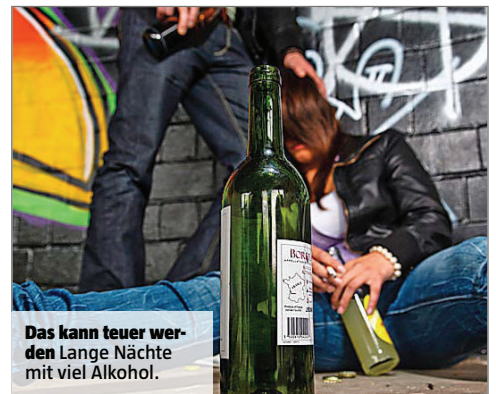
Das kann teuer werden Lange Nächte mit viel Alkohol.